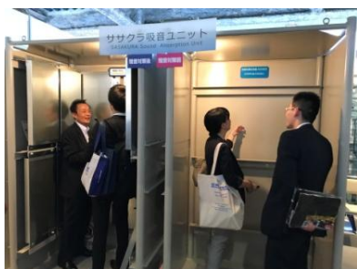
サイレンサー体験の様子