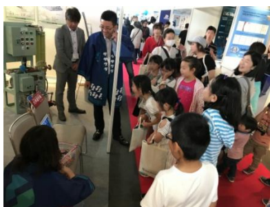
大声選手権の様子