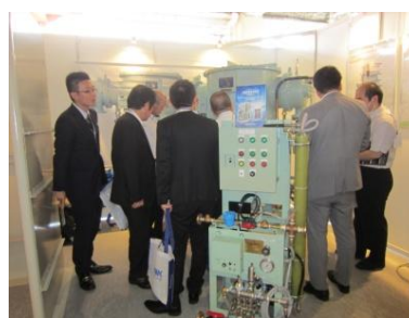
造水装置見学の様子