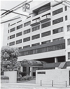
(株)ササクラ本社入口

会場：大阪市西淀川区竹島四丁目7番32号 株式会社ササクラ 本社7階 役員会議室 代表電話（06）6473-2131