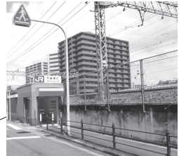
JR東西線「加島駅」 (竹島東口3イ出入口)